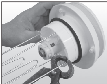
VT-100 / S-100